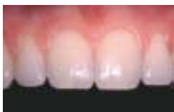
Das Bleichen vitaler Zähne, vor der Aufhellung ...

Unproblematisch sind äußere Zahnverfärbungen, die durch Auflagerungen von Farbstoffen aus der Nahrung (z.B. Tee, Kaffee, Rotwein), durch das Rauchen oder durch Medikamente zustande kommen. Diese können in der Regel ohne größere Probleme durch eine „professionelle Zahnreinigung“ entfernt werden.